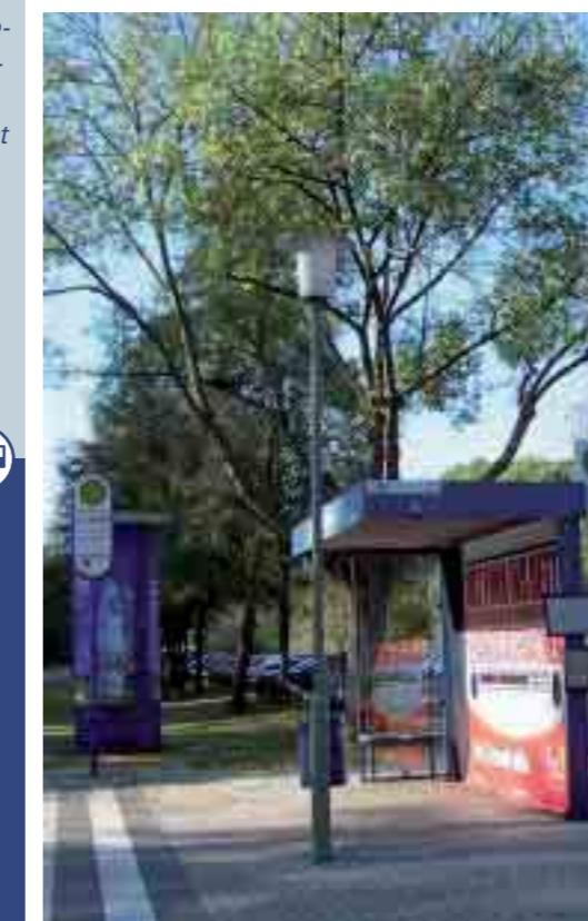
Hanau Bf Wilhelmsbad

Mit dem Beginn des Winterfahrplanes dürfen Sie sich über deutliche Qualitätsverbesserungen auf den Regionalbuslinien im Hanauer Umland und bessere Anschlussverbindungen zu den lokalen Linien MKK-33 und MKK-34 freuen.