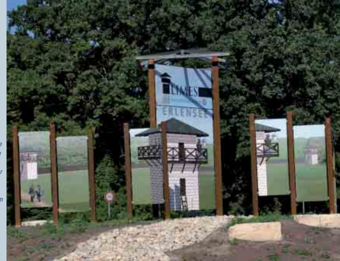
Limes-Kreisel in Erlensee

Öffnungszeiten: Montag bis Mittwoch: 7.00 bis 16.00 Uhr Donnerstag: 7.00 bis 15.30 Uhr Freitag: 7.00 bis 12.00 Uhr