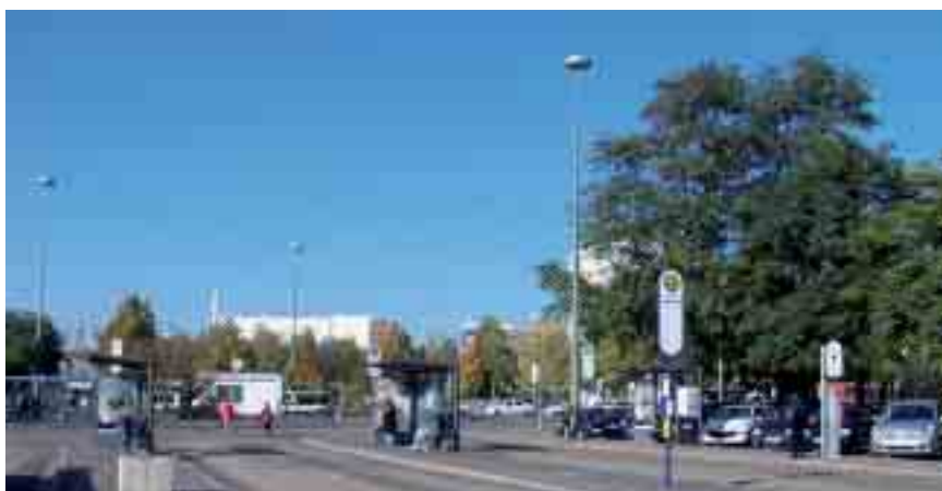
Bushaltestellen am Hanauer Hauptbahnhof

Die KVG Main-Kinzig rät allen Kunden, sich frühzeitig über die Veränderungen zu informieren, damit am ersten Betriebstag keine unliebsamen Überraschungen entstehen. Nur so können die Verbesserungen auch tatsächlich von Anfang an wahrgenommen werden und wir unser Optimierungs-Versprechen halten. Dazu empfehlen wir Ihnen nochmals einen Blick auf unsere Homepage und in die Infobroschüren!