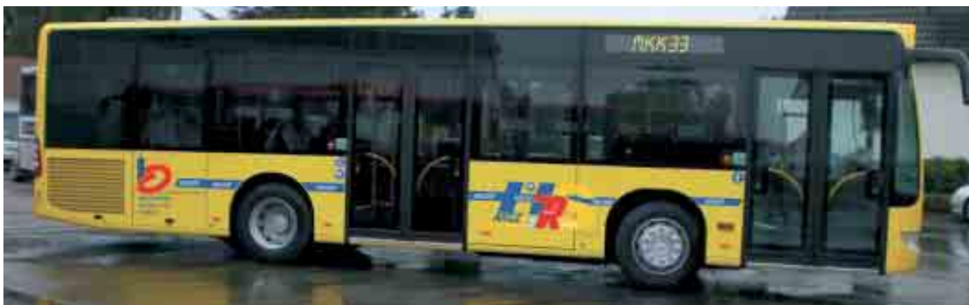
Neues Fahrzeug auf der MKK-33 der ARGE HRS